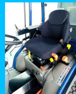
Ergonomiczny fotel operatora regulowany w 5 punktach.